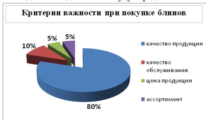
Рис. 3.3 - Критерии важности при покупке блинов (% от общего числа респондентов)

Мы выявили, что большей популярностью пользуется чай, кофе, и натуральный сок, поэтому в нашем меню данные виды напитка будут представлены в наибольшем количестве.